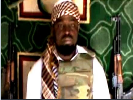
BOKO HARAM LİDERİ: EBUBEKİR ŞİKO

Nijerya'daki Boko Haram Cemaati dünya basınının yansıttığının aksine Nijerya'da İslâmî bir düzenin yerleşmesi için mücadele ediyor, Nijerya Müslümanlarını Afrika'nın kara haçlılarına karşı koruyor.